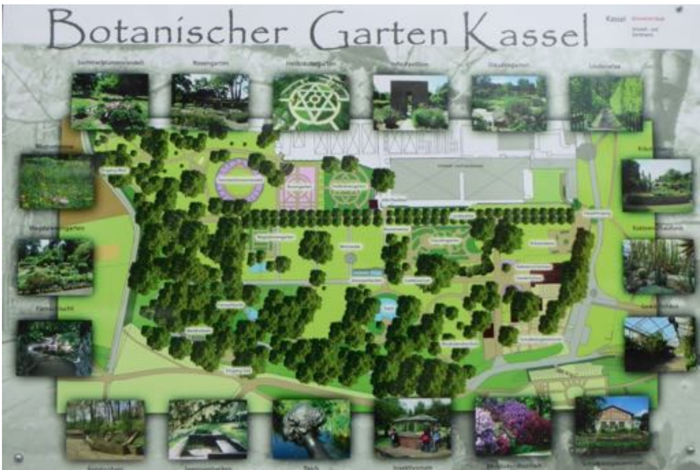
Plakat Stadt Kassel