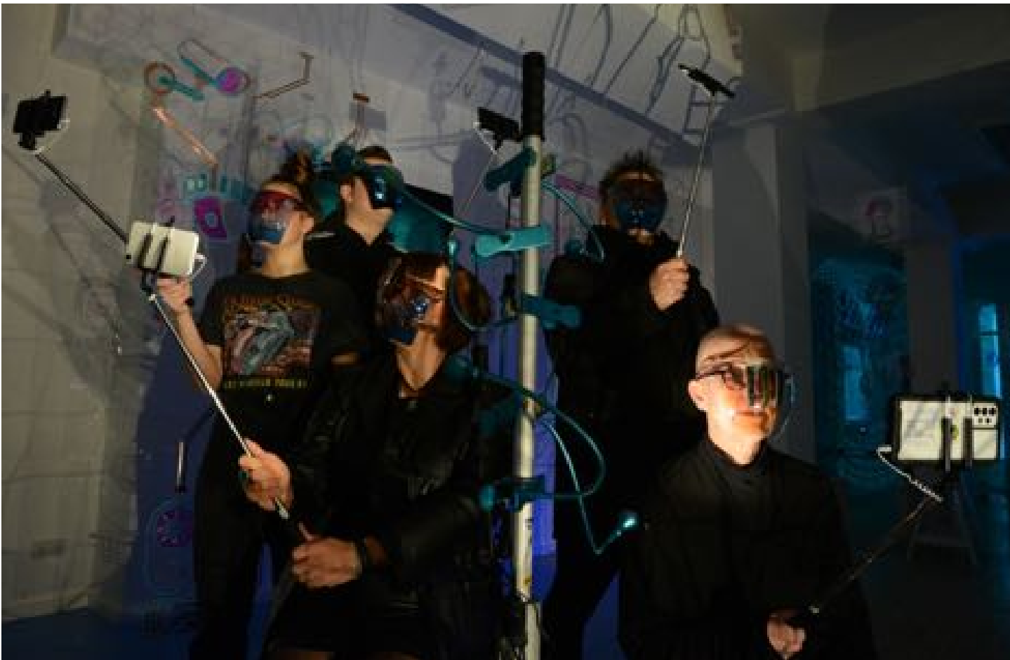
SELFIT-Fotosession; Foto: Manfred Schwellies

Der Projektraum SELF IT konnte besucht werden, um zu verweilen, Gespräche zu führen oder im Selfiemodus zu experimentieren. Jeweils mittwochs bis sonntags von 15 bis 18 Uhr wurden die offene Selfiesprechstunde & freie Selfieproduktion im Projektraum angeboten.