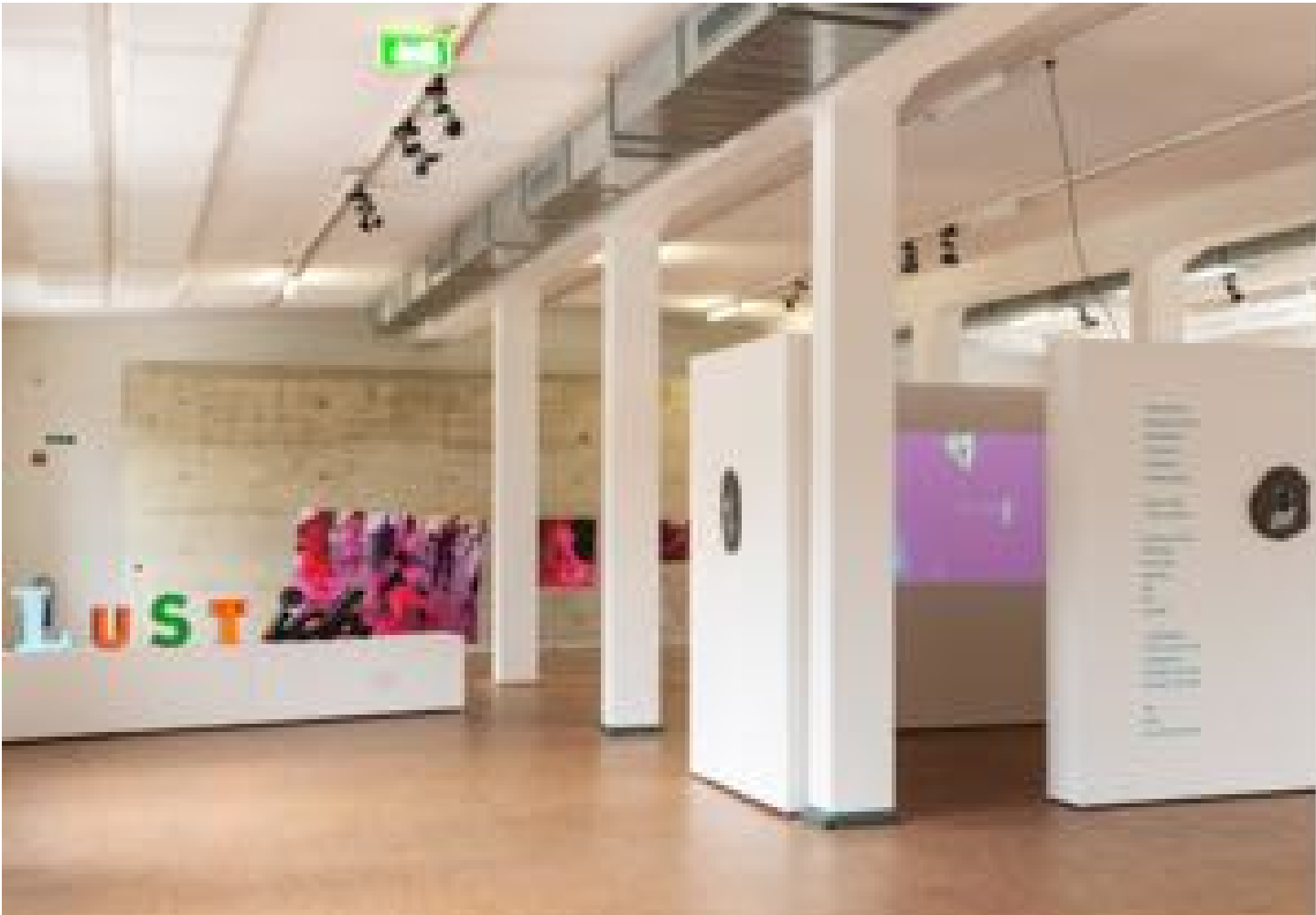
Ausstellung Lust & Frust