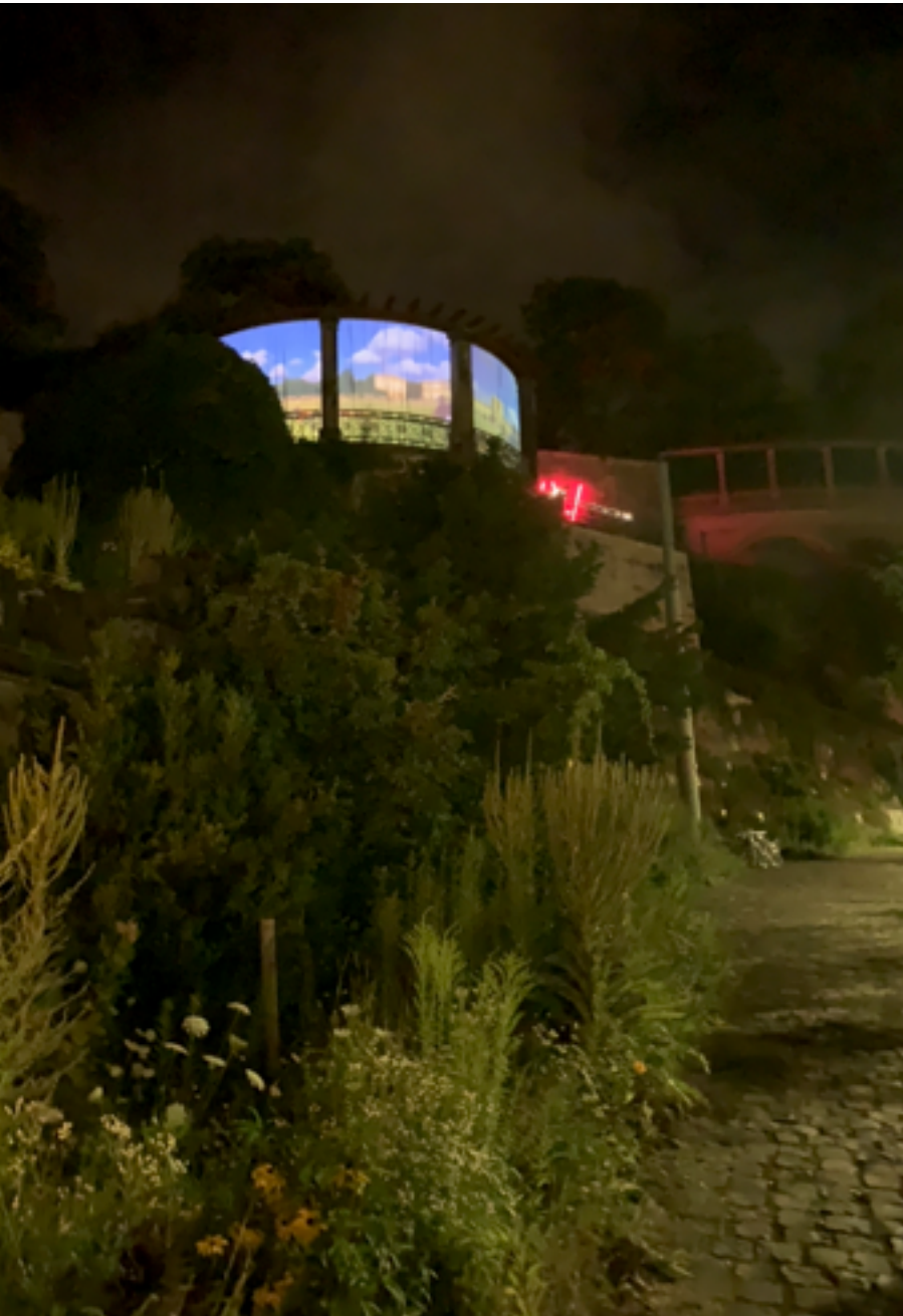
Lichtinstallation auf dem Rondell; Foto: Cornelia Kramm-Rettberg

weiterer mutiger Schritt war es, die Ausstellung gemeinsam mit Künstlern und Künstlerinnen aus Kassel und Umland zu planen und durchzuführen. Der Plan ist aufgegangen. Dankbar nahm eine Vielzahl von Besuchern und Besucherinnen die Möglichkeit wahr, in der Zeit vom 31. Juli bis zum 28. August 2021 die verschiedenen Installationen auf den Weinbergterrassen zu besichtigen, sich damit auseinanderzusetzen und Austausch und Gespräch zu suchen.