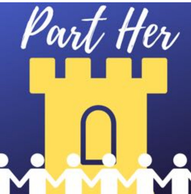
Part Her-Logo, Website: www.Parther.eu

Im Rahmen des EU-Projekts PART-HER (PART als Abkürzung von „European Network for a Participated Valorization of Cultural Heritage“, HER als Abkürzung von Heritage = Erbe) wurde eine digitale Plattform aufgebaut, die es ermöglicht, alltägliches kulturelles Erbe zu erfassen, darüber zu erzählen, Charakteristisches für den eigenen Ort, die Region zu beschreiben. Jeder Eintrag trägt dazu bei herauszufinden, was die kulturelle Identität