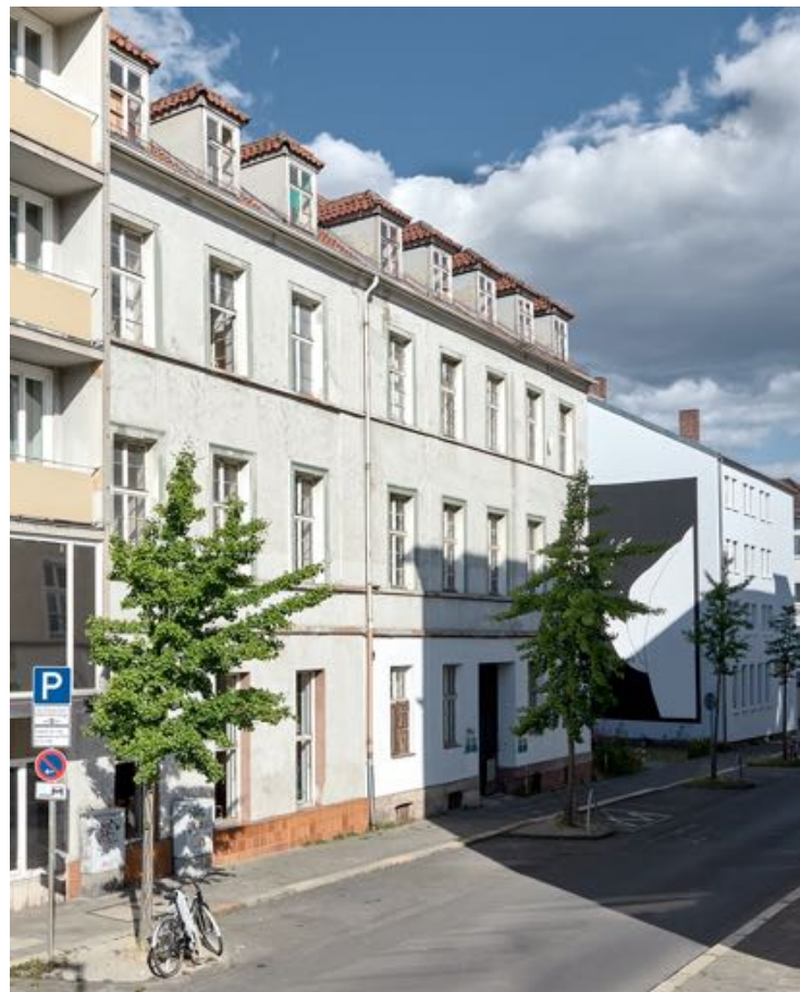
Hugenottenhaus, Foto: Pascal Heußner