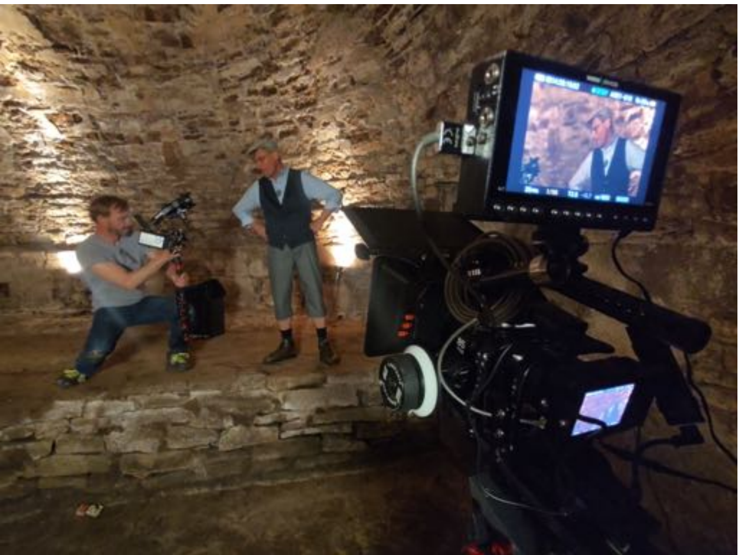
Auf den Spuren einer Stadt; Foto: Andreas Schlenker

Da viele Kinder aus vielen verschiedenen Ursprungskulturen kommen, war es für sie und auch uns interessant, wie die zugewanderten Menschen die