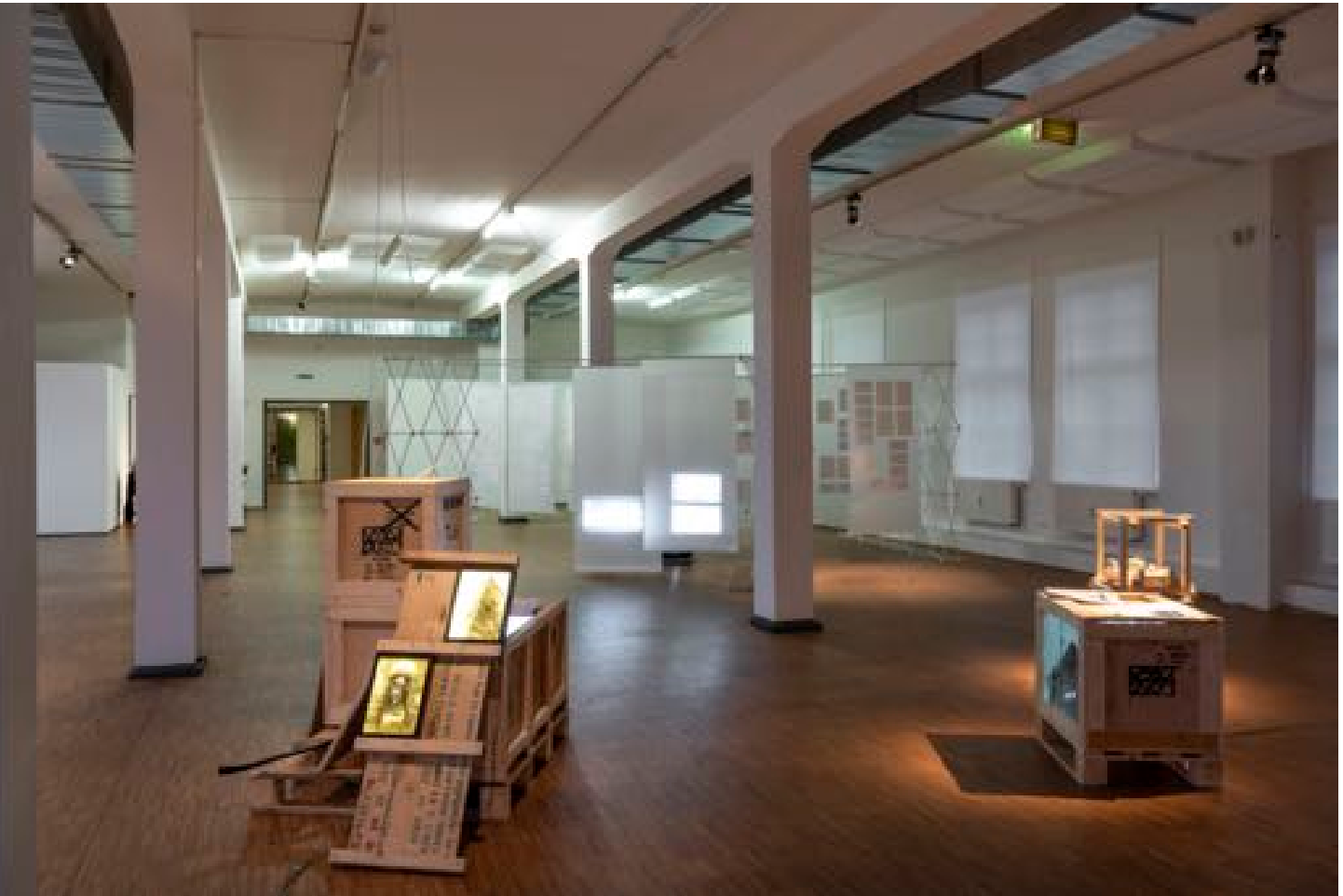
Ausstellung Lost & Found; Foto Wladimir Olenburg

Der Dokumentationskatalog zu den Ausstellungen wird zur ersten Ausstellung der Reihe "387 qm" im April 2022 ("LICHTBLICKE") in gedruckter und digitalisierter Version vorliegen.