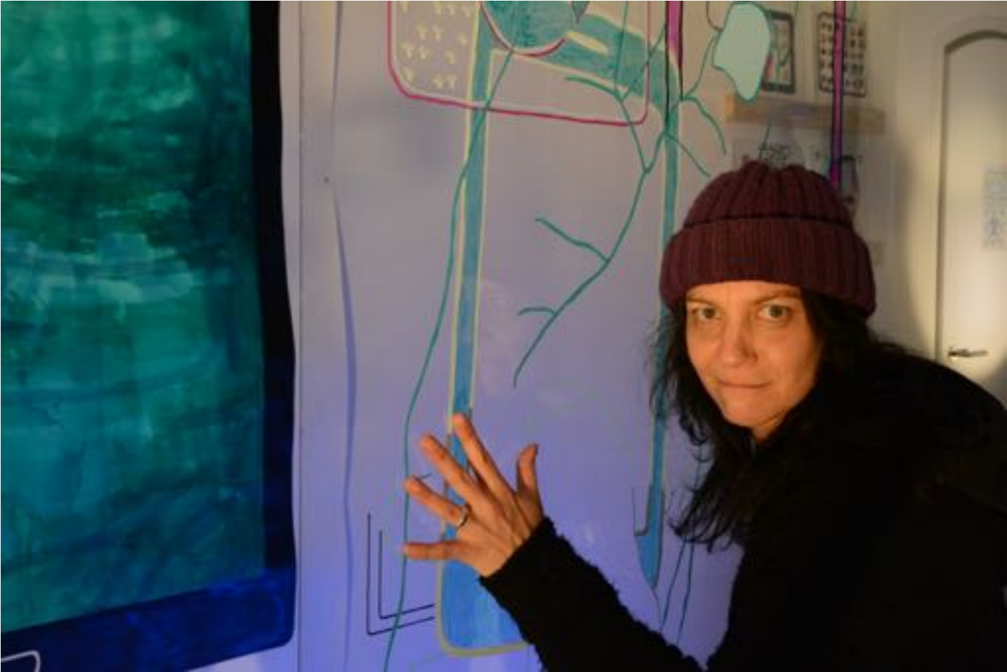
SELFIT Fotosession; Foto: Manfred Schwellies

27.11.2021: #ABOUT OURSELVES #DIGITAL LIFE Performance und Lesung mit Bernd Hölscher und Valeska Weber, soundscape Walter Peter, visions Katrin Leitner