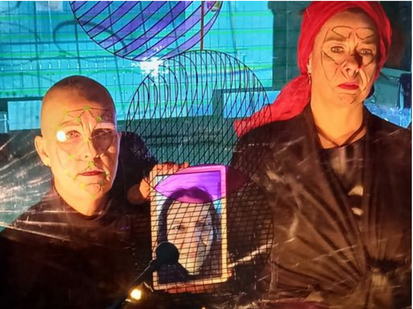
SELF IT 2021; Foto: Biggi Böttcher

SELF IT war beim 38. Kasseler Dokfest als "SELF IT hosting JUNGESDOK-FEST" präsent.