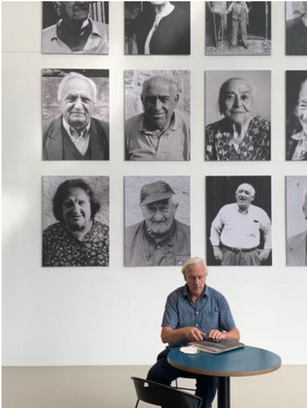
Johann Rosenboom

Land sind zu beklagen. Johann Rosenboom sammelte vor Ort Spuren und verarbeitete sie zu Zeichnungen, Bildern, Skulpturen. Immer wieder ist die Silhouette des Monte Sole zu erkennen. Es entstand „Un Segno per Monte Sole“, tief beeindruckende Artefakte, die zu sehen waren im Kontext der Ausstellung „Welten. Eine Reise nach Epirrhema“, mit Werken Johann Rosenbooms in der documenta-Halle Kassel (29.08.2021 bis 12.09.2021).